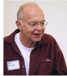
Дональд Эдвард Кнут (р. 1938)